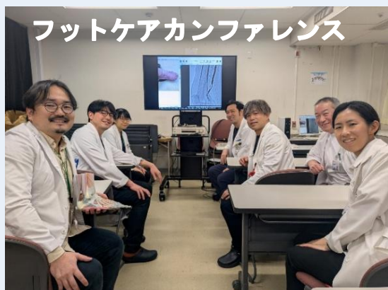
フットケアカンファレンス

当院では多職種によるフットケアチームを設立し、循環器内科を中心に、血管内治療 (EVT) と創傷管理を組み合わせた包括的な下肢診療を行っております。