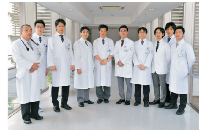
呼吸器内科メンバー