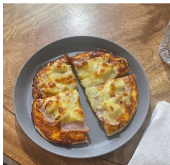
写真3 手作りのピザ

は近距離でカンガルーを見ることができて、見つけることが難しいコアアラも3匹見ることができ、良い思い出になりました。