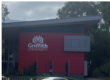
写真 1 Griffith University

また、薬学部の授業体験では AI 技術が搭載されたスマートグラスを着用してスマホなどの映像を 3 次元的に見ることができる最先端の技術に触れました。実際の授業では学生がこの機能を使って AI で創り出したアバター、つまり仮想患者さんに服薬指導の練習を行っていると聞きました。このように、薬学部の授業では AI を上手く活用しており、日本と比べると教育の現場に AI を積極的に取り入れていると感じました。