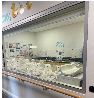
写真 2 産科

心臓の治療の他にも産科や 24 時間の救急科、病院の各所入院患者さんのためのリハビリルームがあり、設備が整っていると感じました。