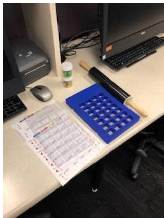
Griffith University での薬学体験