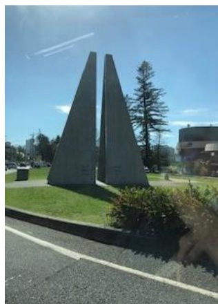
NSW 州と QLD 州の州境