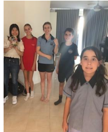
ホストファミリーの子供達