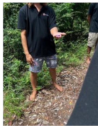
校外学習で試食した木の实