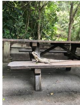
動物園 David Fleay Wildlife Park