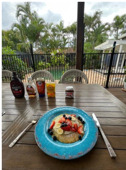
写真6. ホームステイ先での朝食

私は2人で一つの家庭にホームステイさせていただきました。久しぶりのホームステイで少し緊張していましたが、ホストマザーが暖かく迎え入れてくれたため、毎日楽しく過ごすことができました。ホームステイ先の向かいの家庭とバーベキューをしたり、ホストマザーのご両親や甥っ子たちと遊んだり、たくさんの現地の方々とお話できる機会があり過ごす時間が長くなるにつれて徐々に自分の力で話せるようになってとても嬉しかったです。毎日おしゃれな食事を用意してくれたり、休日に限らず平日の学校終わりにもビーチやスーパー、観光地に連れて行ってってくれたりしました。夕方からビーチでピクニックをして満点の星の空を見ることがやコアラやカンガルーと触れ合うなど日本ではあまり体験できないようなことをオーストラリアで楽しむことができました。