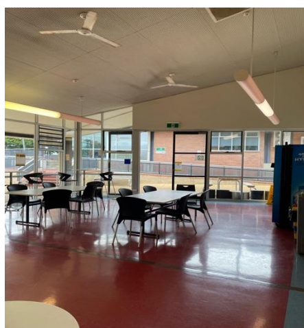
写真2. TAFEの食堂の様子