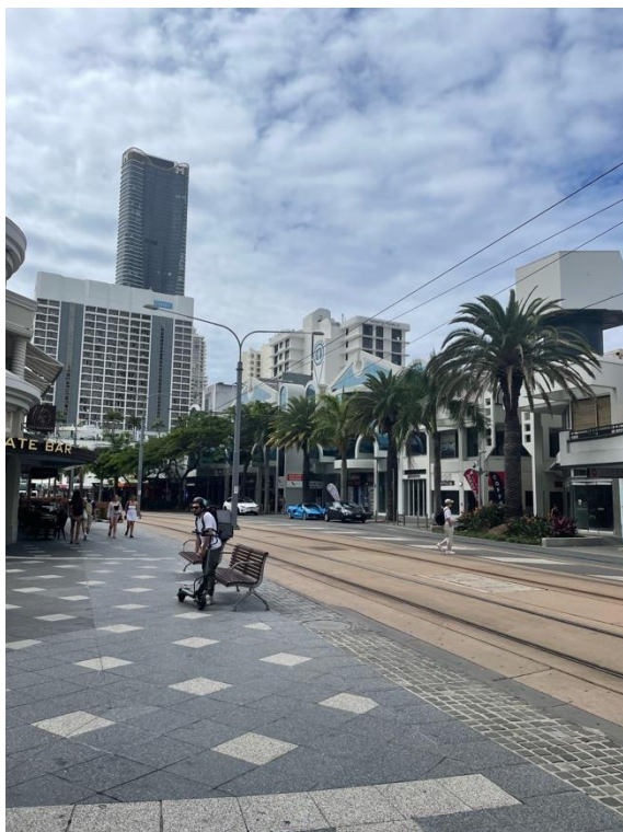
写真7. サーファーズパラダイスの街中

今までの海外研修のなかで海外での滞在期間が一番長く、久しぶりだったこともあり少し不安でしたが楽しい出来事が多く、時間が過ぎるのがあっという間でした。自分の力不足を実感することが多く、自分のスキルを向上させるための良いきっかけになりました。他の国にも訪れてもっと経験を積み、視野を広げていきたいと思いました。