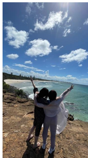
写真4.アボリジニについての 課外活動の様子