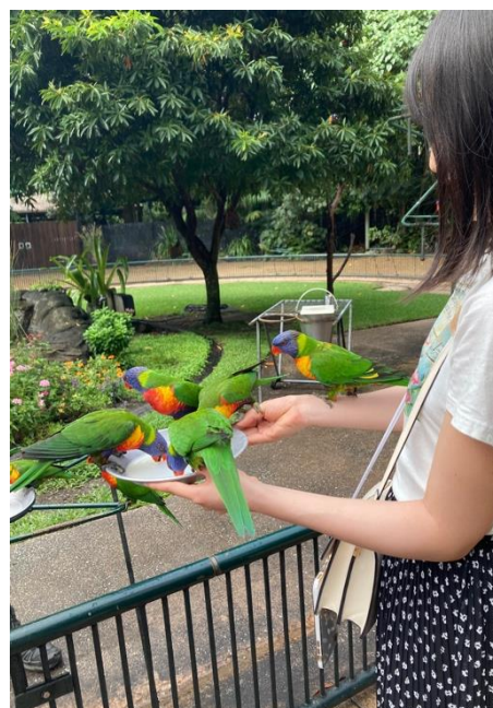
動物園で鳥の餌やり体験