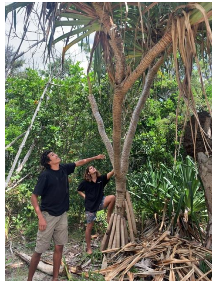
アボリジニの授業