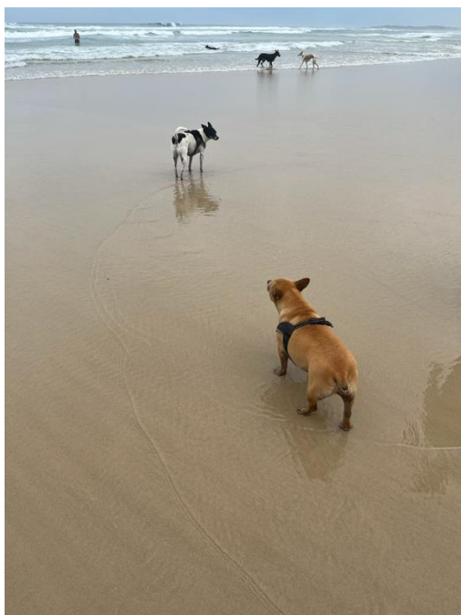
Cabarita Beach で

ちゃん2匹と一緒に散歩がてら行くにはもったいないほど綺麗で広い beach でした。マーケットや2人のオススメ Byron Bay、ここに行きたい！と下調べをあまりしていなかった私のために、どうやったら短い滞在期間の中で楽しめるかを沢山考えてくださって感謝しかありません。毎日の食事もとても美味しくとても幸せな出会いと日々を過ごさせていただきました。日本、オーストラリア、イタリアそれぞれの文化の違いについて沢山お話が出来た時間がこの研修期間の中で1番楽しい時間でした。