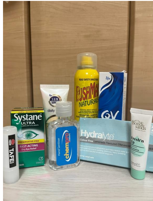
Gliffith University でいただいたお土産たち