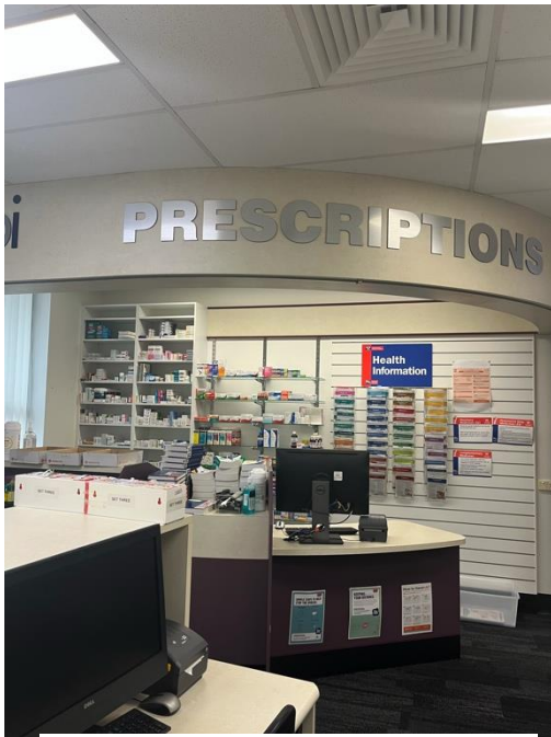
Gliffith University のパソコン室の一角 薬がたくさん置いてありました

現地の実際の医薬品を試飲してみたり、講義にて日本とオーストラリアの薬局形態の違い、日本のように一般用医薬品、医療用医薬品と医薬品が二分するのではなくもっと細かく分類があること、保険様式の違いなど細かい部分まで学んだりすることができました。また、English class とは違い内容のレベルが上がるので、単語の難易度や話すペースなどが全く異なり、実際海外で進学するとこのような英語のレベルになるのかと留学のリアルを痛感しました。