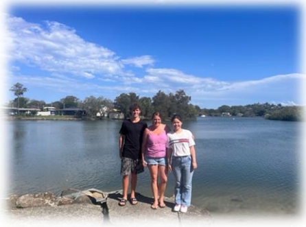
ホストファミリー