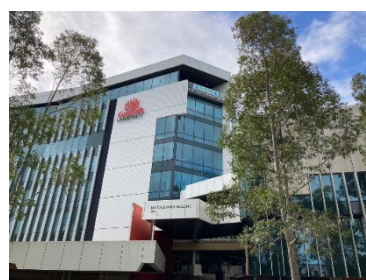
写真3 Griffith University