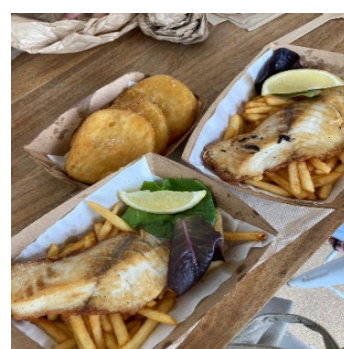
写真6 バラマンディ とホットチップス