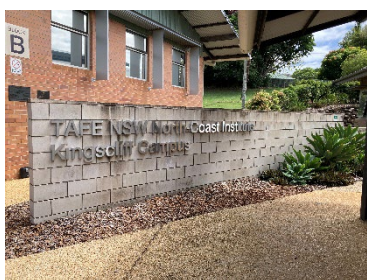
写真1 TAFE Kingslife 校

今回、オーストラリア薬学語学研修に参加させていただきありがとうございました。この研修でとても貴重な経験を得られました。ホームステイでは、ホストファミリーとの素敵な思い出ができました。現地校では、初めて出会った参加者と一緒に充実した日々を過ごすことができました。10日間がとても濃くあっという間で、もっとオーストラリアにいたいと思うほどでした。私を温かく受け入れてくれたホストファミリー、他の参加者、現地校の先生方に感謝しています。これからは英語を使ってより多くの人とコミュニケーションできるように勉強に励みたいです。オーストラリアでの経験を活かし、日々精進していきます。