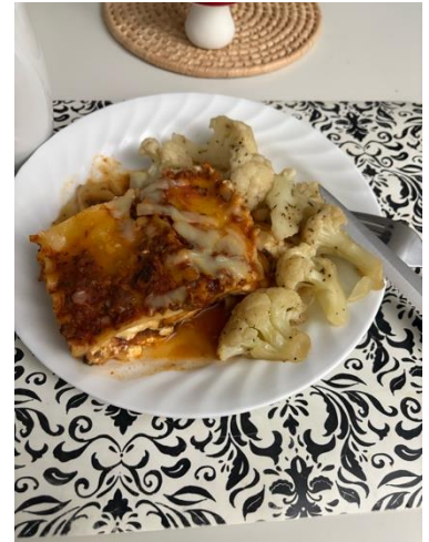
ホームステイ先での食事

お母さんはとても料理上手で、お父さんはテレビを見ているのをよく見かけました。晩ご飯の時間は大体6時半から7時頃でした。ホームステイ先には、私の他に2人の韓国人留学生がいました。時間が合えばみんなで晩ご飯を食べますが、ほとんどの時は時間が合わず、別々で食べていました。タイミングが合った時は、その日の学校のことや、週末の予定などを話していました。私の部屋は地下にあり、地上の部分にリビングやキッチンなどがありました。お風呂は15分以内で済ませること、11時以降はキッチンを使わないこと、11時以降物音を立てないようになど、いくつかのルールがありました。