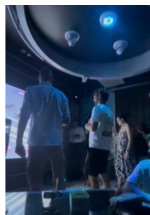
カラオケでの様子

Young Scientists Dinner は、40歳以下の若手研究者を対象とした交流会が開かれました。夕食の場では、英語でそれぞれの研究内容や日常の趣味などについて語り合い、互いのバックグラウンドを共有することができました。英語でのコミュニケーションは次第に打ち解け、国籍や分野を超えて意見を交わすことができたのは非常に貴重な経験でした。その後はカラオケにも行き、皆で大きな声で歌いながら盛り上がり、終始笑顔の絶えない時間を過ごしました。学会の雰囲気とはまた違う形で交流を深めることができ、忘れられないひとときとなりました。