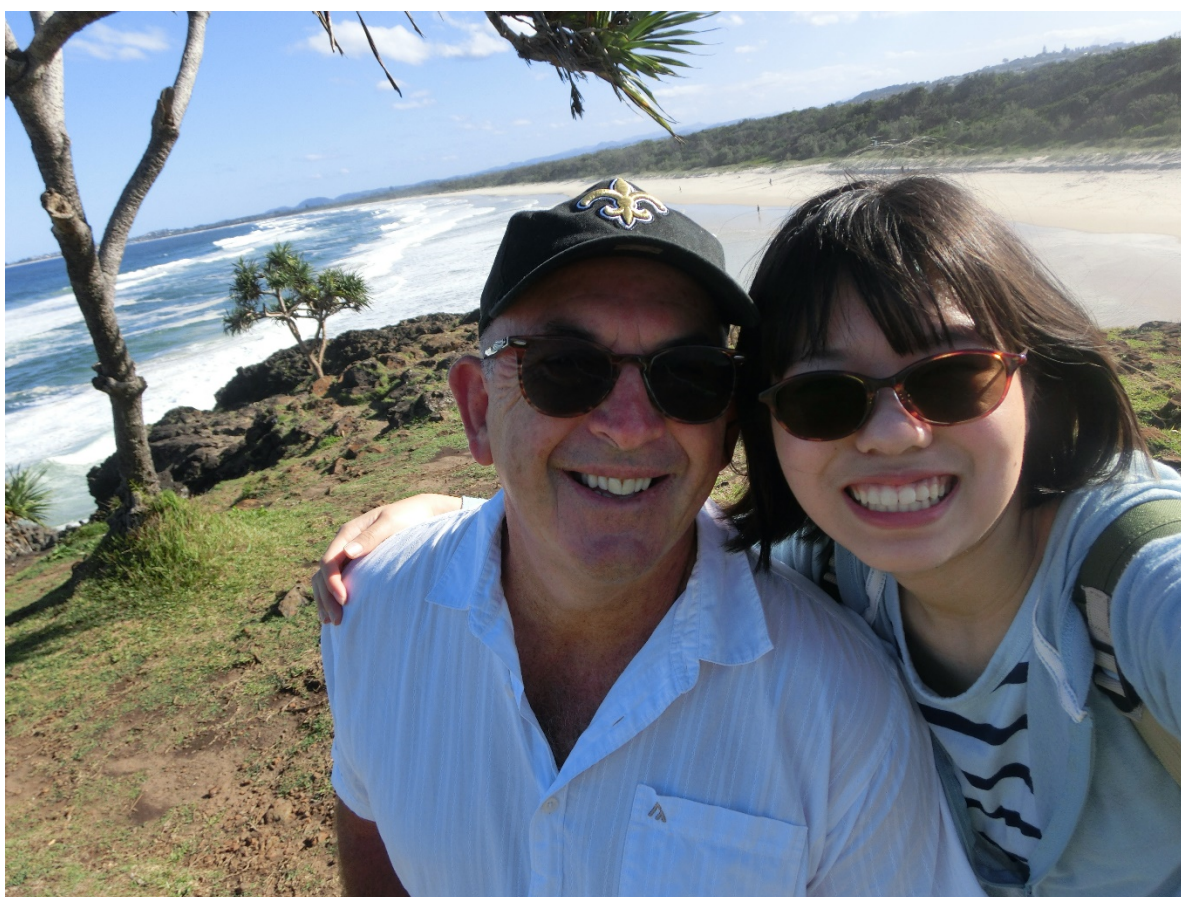
Figure 10 Finger Head にて