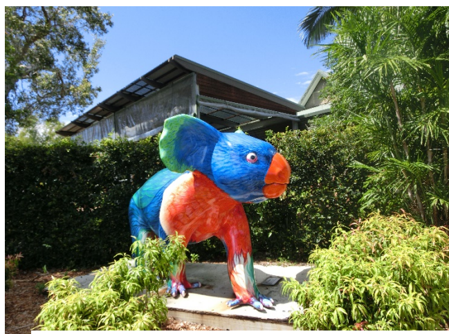
Figure 6 カランビン自然動物保護園

野生動物のための救急・応急処置施設があり、車にひかれたコアラや海のゴミがくちばしに絡まった鳥等が保護されている。オーストラリア大陸に存在する様々な動物が飼育されており、自由に園内を散策できる野生動物の保護園。また、コアラを抱っこしての写真撮影、カンガルーへの餌付け等が出来た。