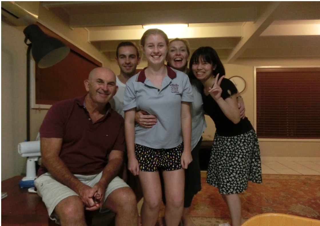
Figure 9 私のホストファミリー