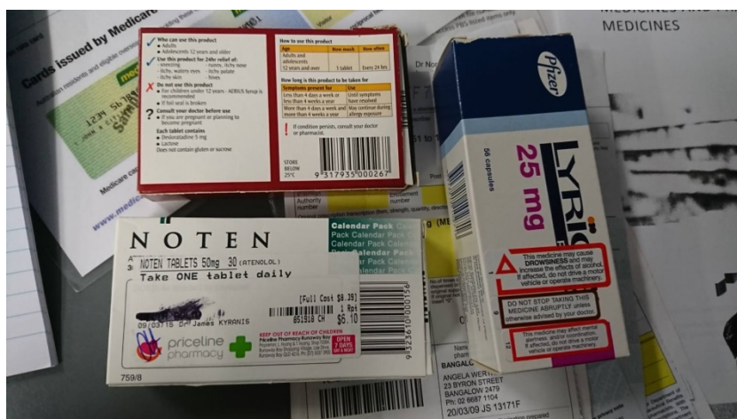
Figure 5 箱出し調剤の様子

また、紫外線が強すぎるので、高齢者や幼児は外になるべく出ないようにしている。そのため、ビタミン D が不足しており、それを補うビタミン剤も豊富に並んでいた。