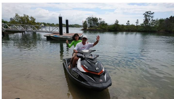
Figure 8 ジェットスキーの様子

一番の思い出は、人生で初めてジェットスキー(水上バイク)に乗せてもらったことだ。波の上を高速で走り抜けたときに、船体が波を乗り上げる感覚が、クセになるほど楽しかった。また、川から海に向かって走ったのだが、海からビーチを眺めたときは本当に感動したのを覚えている。