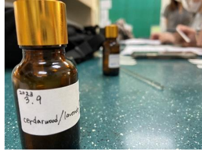
マッサージオイル