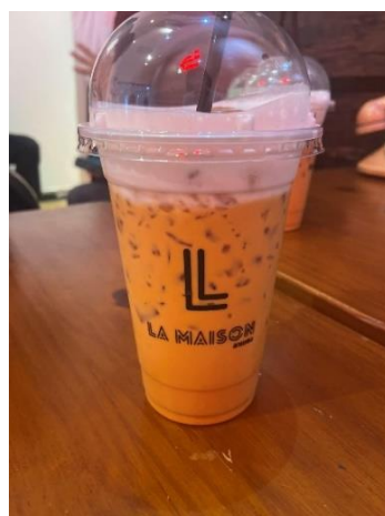
大学内のカフェのタイティー