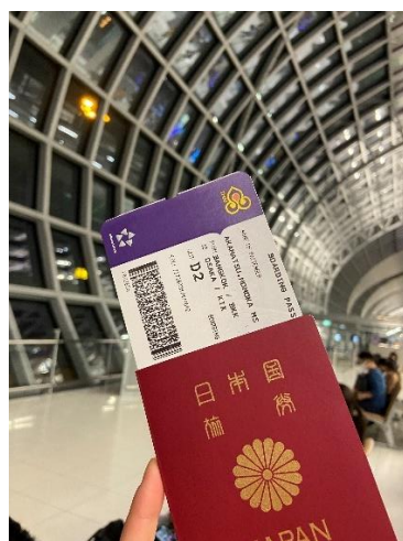
帰りのスワンナプーム国際空港