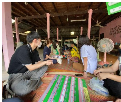
お薬カレンダーをつくる様子