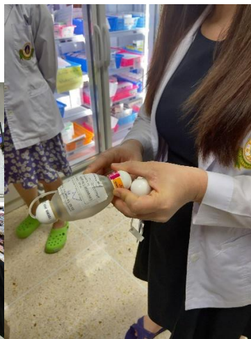
home medical chemotherapy のための装置

次にラマティボディ病院のなかのほとんどすべての薬を調剤をしている部屋に行きました。外来の患者の薬から入院の患者の薬までをこの部屋で調剤していました。各階の病棟にエレベーターで薬を届けていました。処方箋の数もとても多いので、部屋のなかは大変忙しそうでした。そんな中で間違いを防ぐために、かごの色や札を使って工夫されていま