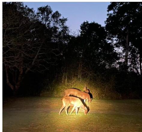
夜の動物観察で見つけたシカ