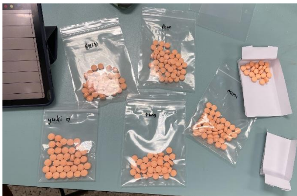
製剤実習で作成したビタミン剤

薬学部の2年生と3年生の学生さんの実習の授業に参加させてもらえる機会がありました。授業はタイ語での説明でしたが、同じチームの人たちが英語に訳して教えてくれたので特に不自由を感じることはありませんでした。生薬の授業では私たち用に実習資料を英語に訳したものを用意してくださっていました。実習中はたくさんの学生さんが声をかけてくれ、大阪の話や趣味の話で盛り上がりました。日本が好きな人が多く、何人か日本語で自己紹介してくれました。ほかにも関西弁を教えたり、タイ語を教えてもらったりと充実した時間を過ごすことが出来ました。