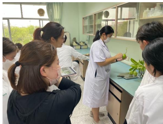
生薬学実習の様子