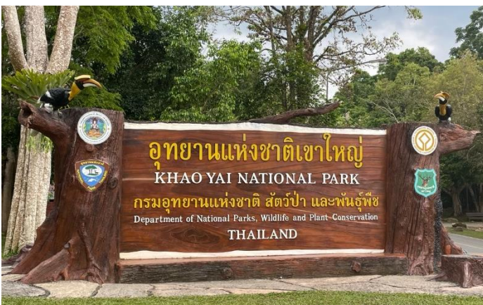
カオヤイ国立公園

学校の先生と学生さんと一緒にカオヤイ国立公園に 2 日間にかけてハイキングに行きました。野生動物が多く生息しており、到着する少し前からサルの群れを見ることが出来ました。コテージで早めの晩御飯を食べ、夜になると車の荷台に乗って動物観察に行きました。シカやヤマアラシ、キツネなど様々な動物を見ることが出来ました。そのあとはみんなでカップ麺を食べて UNO をして遊びました。翌日はガイドさんとともにハイキングに行き、植物や動物についての説明を受けながら歩きました。