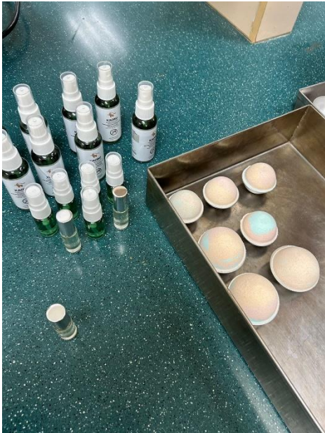
虫よけとバスボブ

虫よけ、バスボブを作成しました。基本、材料の重さをはかって順番に混ぜていくだけで完成させることが出来るように簡単な方法を用意してくださっていたので楽しく作成することが出来ました。フレグランスを自分で決めることが出来たので、たくさんあるサンプルの中からみんなでどの匂いがいいか話し合ったのもいい思い出です。バスボブはカップに沢山の粉を入れて固めなければ型はずす時崩れてしまうので、粉が少なくなってきたあたりから少し作るのに苦労しました。