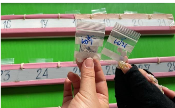
薬を入れている袋 (右:朝用 左:晩用)

滞在中、2つのご家庭に訪問させていただきました。統合失調症を患われている患者さんのご家庭と、高血圧、脂質異常症、心疾患を患われている患者さんのご家庭でした。医師、看護師、薬剤師の方々と訪問し、お薬カレンダーに朝用と晩用の2つの袋を日ごとに詰めていく作業や、血糖値の測定、血圧の測定を行いました。飲み間違いのないように朝用の袋を前にして重ねて詰めることや、患者さんに「この薬はどのような薬で、いつのまなければならぬのか」といった内容の質問をし、処方されている薬を理解出来ているのか確認していました。在宅治療の対象となる方は病院から遠く離れた場所に住んでおり車もなく近くにスーパーなどもないため、お米や水といった食料品も届けていました。