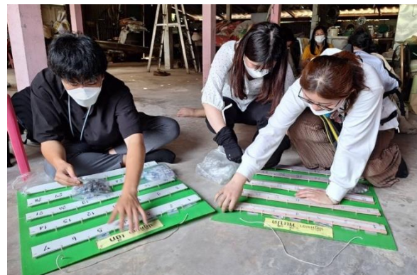
お薬カレンダー作成の様子