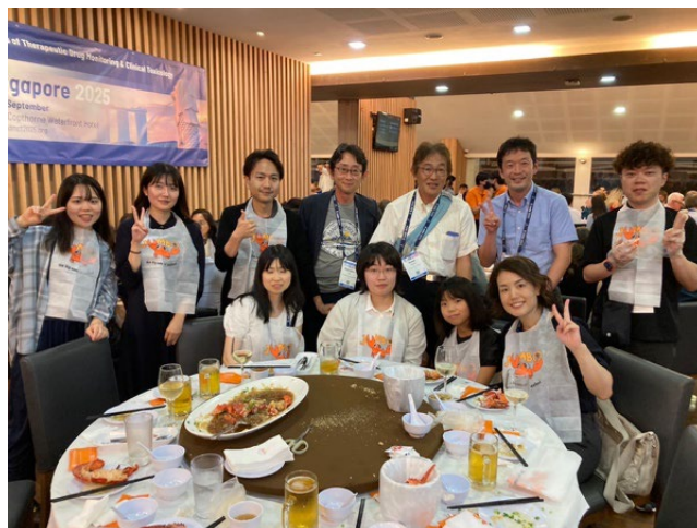
写真 4 Congress Dinnerの様子

最後に、今回の国際交流事業を助成下さった大阪医科薬科大学国際交流基金に厚く御礼申し上げます。また、その他様々な面でサポート頂いた方々に深く感謝致します。