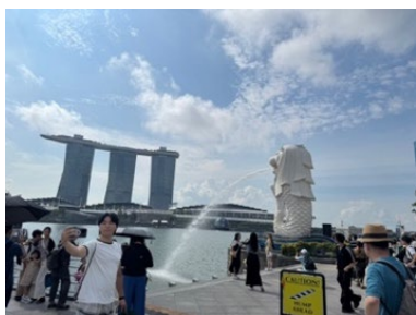
写真 5 マーライオン

学会の合間には、シンガポール中心部を散策しました。マーライオンやマリーナベイ・サンズ周辺を訪れ、近代的な都市景観と自然が調和したシンガポールの魅力を感じることができました。また、多国籍な文化が融合した街並みや多彩な食文化にも触れることができ、国際都市としての特徴を実感しました。