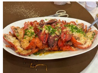
写真 3 Congress Dinner の料理

4 日目は「Exploring Involvement of the Immune System and Biomarkers in Brigatinib-Induced Liver Injury」という演題でポスター発表を行いました。英語での発表であったため、事前に原稿作成や発音練習を繰り返し準備しました。海外の参加者に伝わるか不安もありましたが、発表自体概ね伝えることができました。一方で、質問の意図を正確に理解できず、十分に回答できない場面もありましたが、今後の課題や研究の方向性について有益なコメントをいただくことができ、有意義な発表となりました。