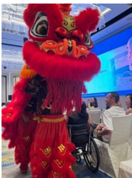
写真 2 Opening of Congress の様子

1 日目はワークショップと Opening of Congress に参加しました。ワークショップでは、マレーシアをはじめとする各国の研究者と同じグループになり、HPLC システムを用いた TDM の一連の過程を体験することができました。