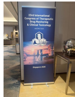
写真 1 学会ポスター

International Association of Therapeutic Drug Monitoring & Clinical Toxicology (IATDMCT) は、TDM と Clinical Toxicology に関連する国際学会です。今年は、「Creative solutions for global challenges」をテーマに国際的な交流拠点であるシンガポールにて開催され、世界各国から多くの医師や薬剤師をはじめとした専門家が参加しました。