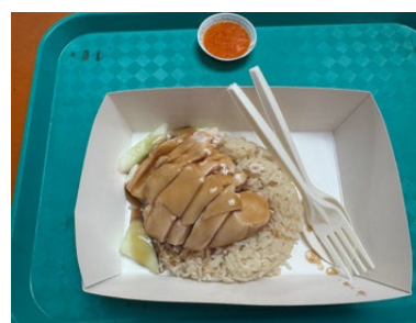
写真 7 天天海南雞飯のチキンライス