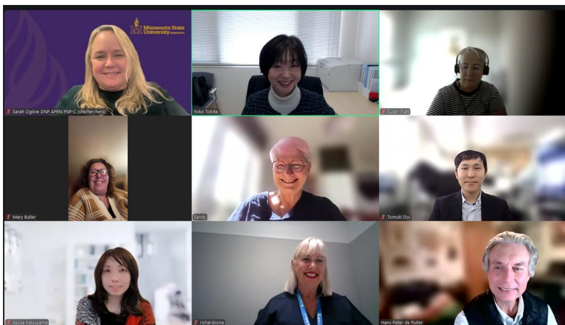
2025年度 Semester II 写真 (2026.3.18)